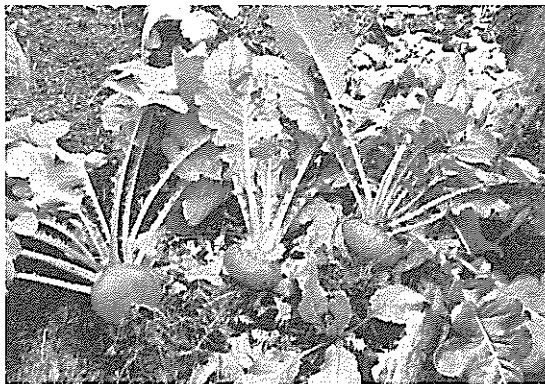
写真3 収穫した河内赤カブ

以上で2002年の焼畑体験は終了した。辛い体験だったが、終わってみると苦勞を忘れて「やったな」という満足感を持つとともに、頭で考えることと実践