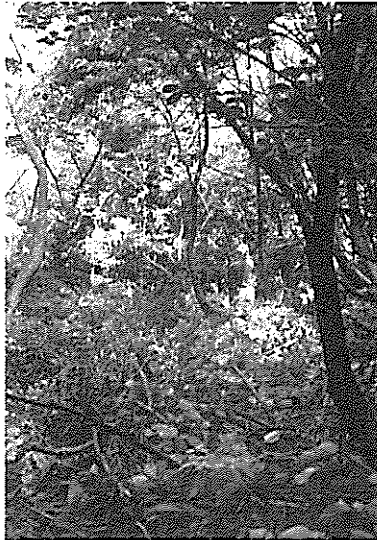
写真1 伐採前の焼畑用地

持って4-5mの崖を攀じ登って山中に入り、すぐに草刈り、立ち木の伐採作業を始める。それぞれがもつ得物は鎌、鉋、鋸、草刈機、チェーンソーなどであるが、やはり草刈機、チェーンソーが威力を発揮し、たくましい音を立てて作業がはかどる。草を刈り、立ち木を切り、切った木の枝葉を払い、長い木をいくつかに切り分ける。ブナ、クヌギ、ナラ、サクラ、クリ、アカマツ、スギなどを相手に格闘していると、夏の盛りで30分もすると汗が噴き出してくる。