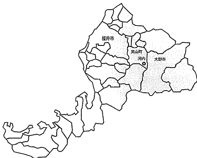
図2 福井県美山町河内の位置図（森下英樹氏作成）

河内赤カブは紅色系のカブで、飛騨の赤カブ、大野紅カブとともに全国的に著名である。現在の栽培形態は山林での焼畑栽培と水田転作による平地栽培が