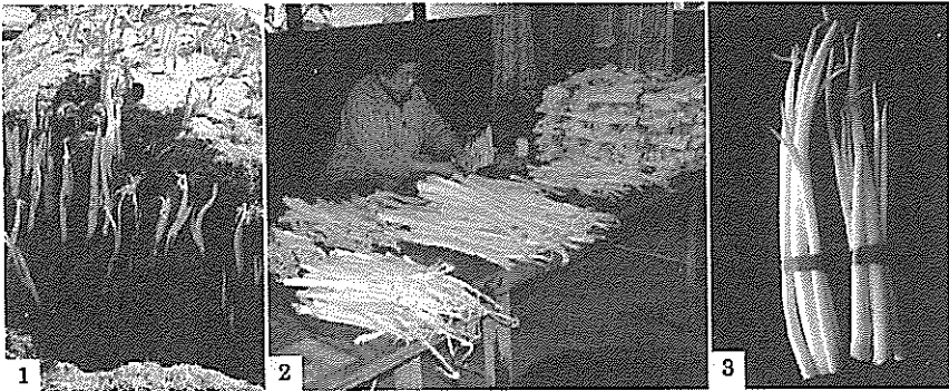
第2図 収穫期の芽芋およびその収穫。