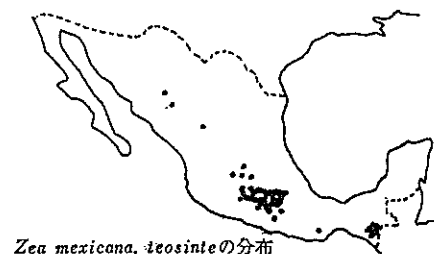
第3図 インゲンマメ( Phaseolus vulgaris )の野生系統とテオシント( Zea mexicana )のメキシコにおける分布 [上は MIRANDA 1967a, 下は HERNANDEZ 1973 より改写]

種子数は、最も小さい場合は50個で通常1莢当たり8~10個の種子が入っている [MIRANDA 1967a]。