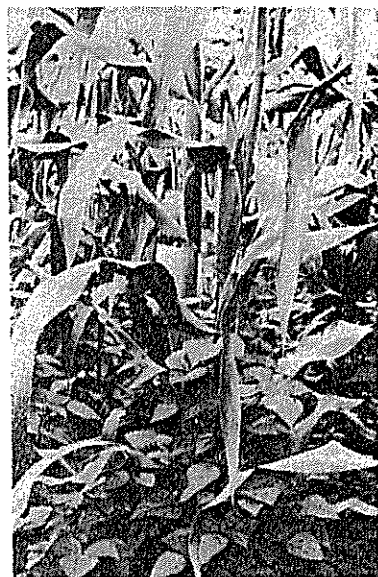
第1図 トウモロコシとインゲンマメの混作 (メキシコ州) (著者原図)

さて、メキシコでは伝統的にトウモロコシとインゲンマメが混作されることが多く、その場合インゲンマメはつる性のものが用いられ、トウモロコシを支柱としてこれにからまって生育する(第1図)。