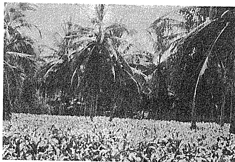
第4図 ココヤシとトウモロコシの混作 (コリマ州)

メキシコ市からワチナンゴを経てポサ・リカ (Poza Rica) に至るこの東部シエラ・マドレ山系の道路は短い距離の間に高度が2,000m余も降下するので