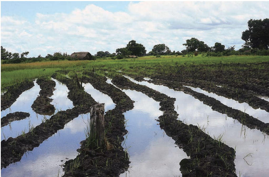
写真2 イネの畝立て栽培 (2004年4月撮影：モロゴロ州マリニ県イテテ地区)

これらのことからタンザニアにおける稲作は、20世紀の半ばまで同国の多様な生態条件下へと広がり、そこで多くのバリエーションが出来上がっていたことがわかる。しかし、ほとんどの場所で人々は環境を制御せず、その土地の環境条件に稲作の農法を合わせるような形でイネを栽培してきたといえる。さらに多くの場所でイネはトウモロコシやモロコシ、トウジンビエなどと組み合わせられて栽培されてき