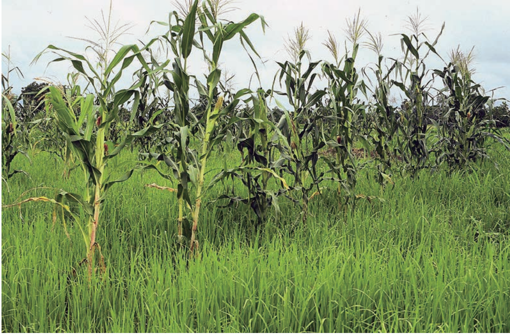
写真1 水田で混作されるイネとトウモロコシ (2004年3月撮影：モロゴロ州マリニ県イテテ地区)